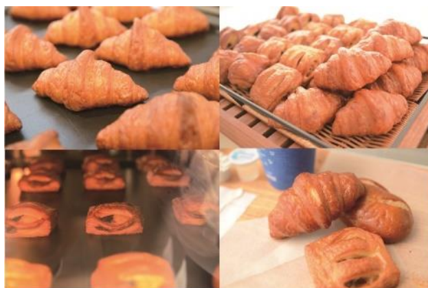
焼き立てパン（イメージ）